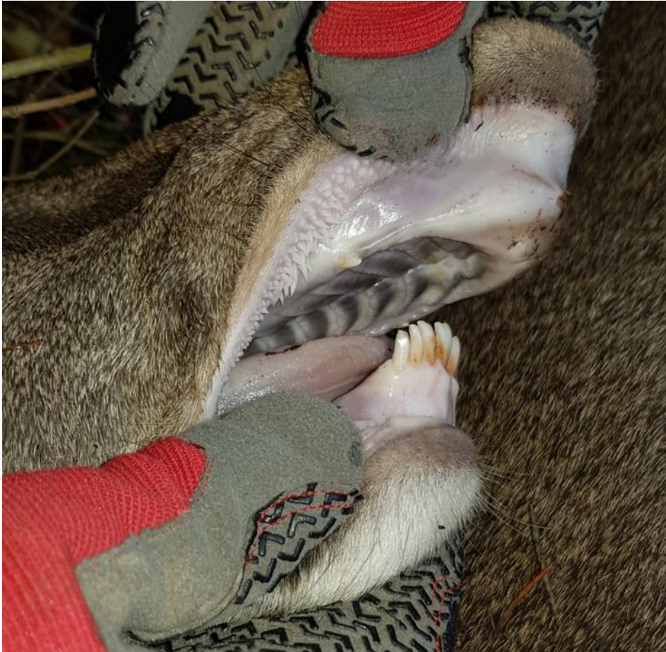
Abb. 2: Inzuchtdepressionen, wie die Unterkieferverkürzung bedrohen die Gesundheit und das Wohlbefinden des Rotwildes und lassen massive Einbußen für Fruchtbarkeit und Vitalität der betroffenen Populationen befürchten.