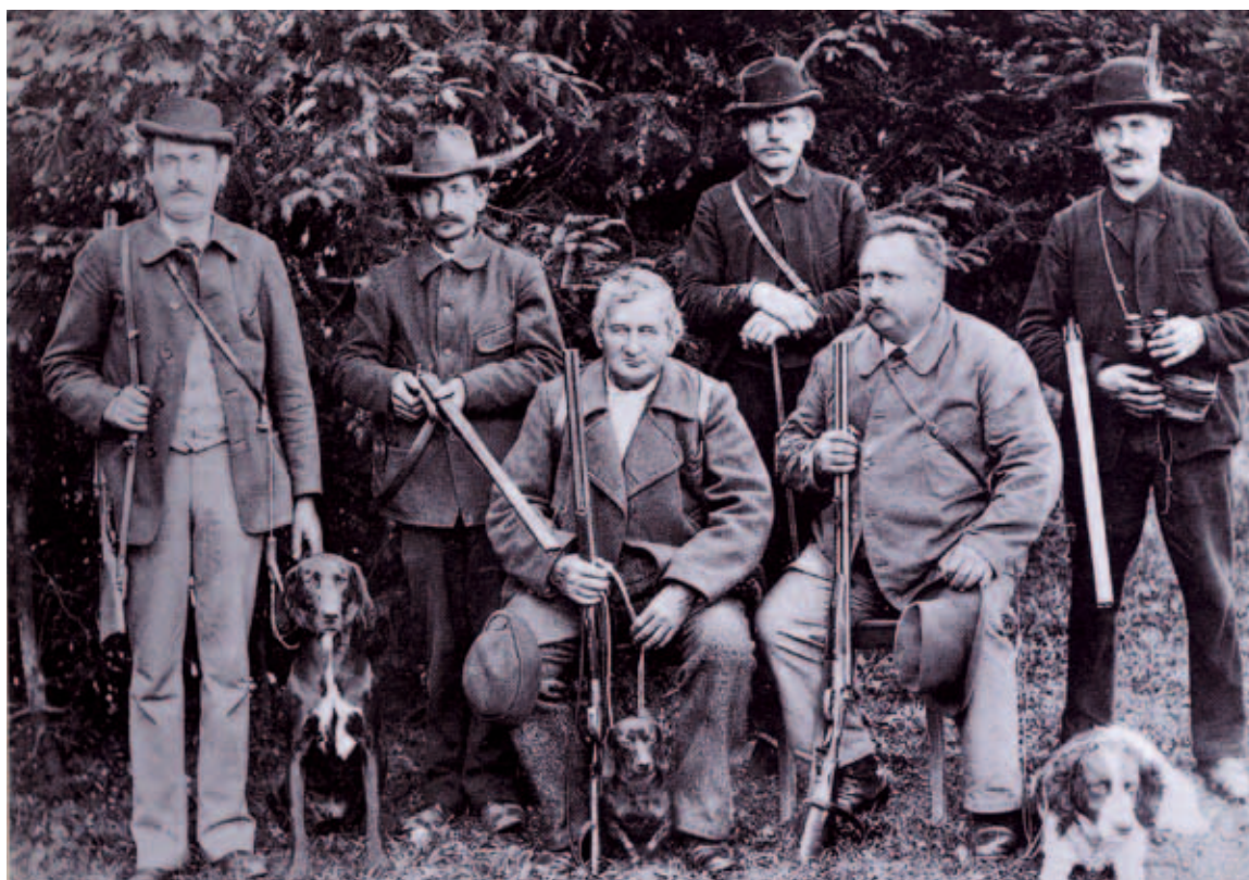
Kützberger Jäger kurz nach der Jahrhundertwende. Sie zählten zur ersten Generation der Jäger, die sich gegen Ende des 19. Jahrhunderts zu Vereinen und Verbänden zusammenschlossen.